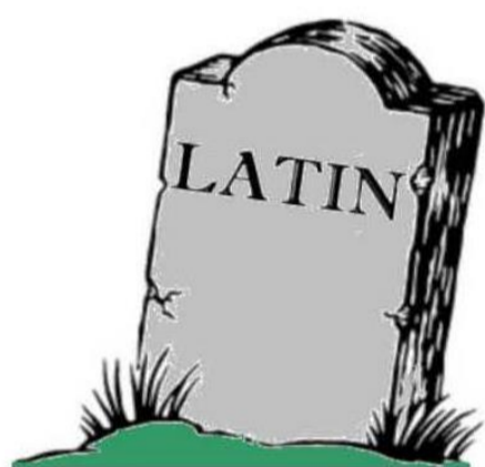
Une langue morte ?